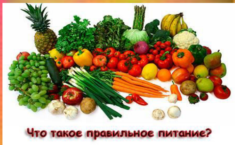
Что такое правильное питание?